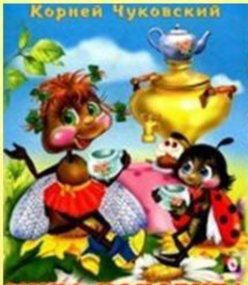
МУХА-ЦОКОТУХА ФЕДОРИНО ГОРЕ