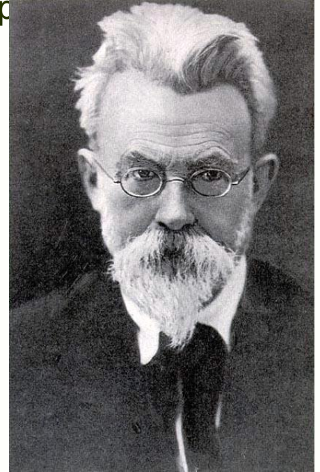
В.И. Вернадский (1863-1945)