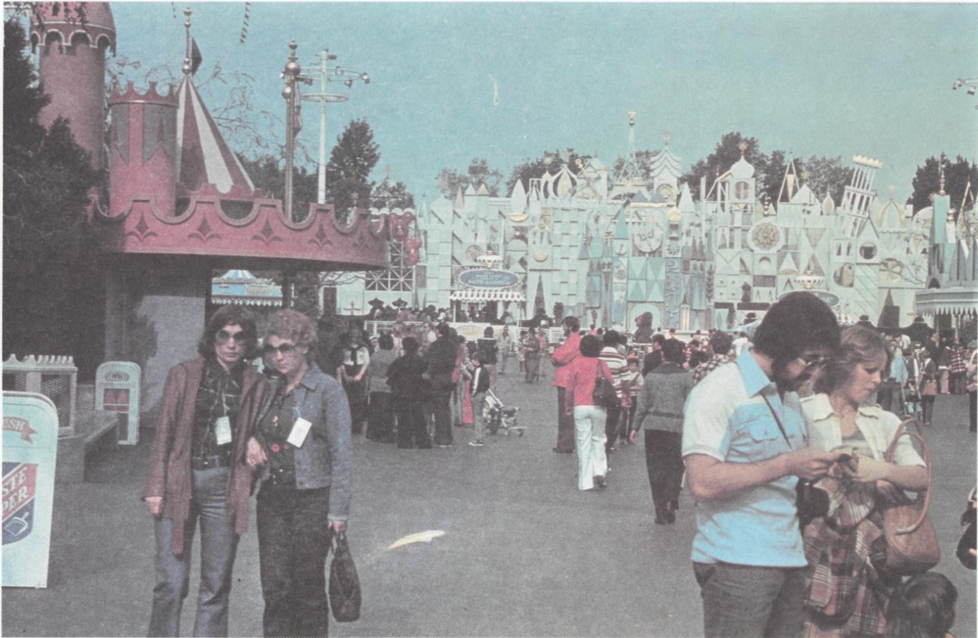
86. Los Angeles. Disneyland. Fairy Castle