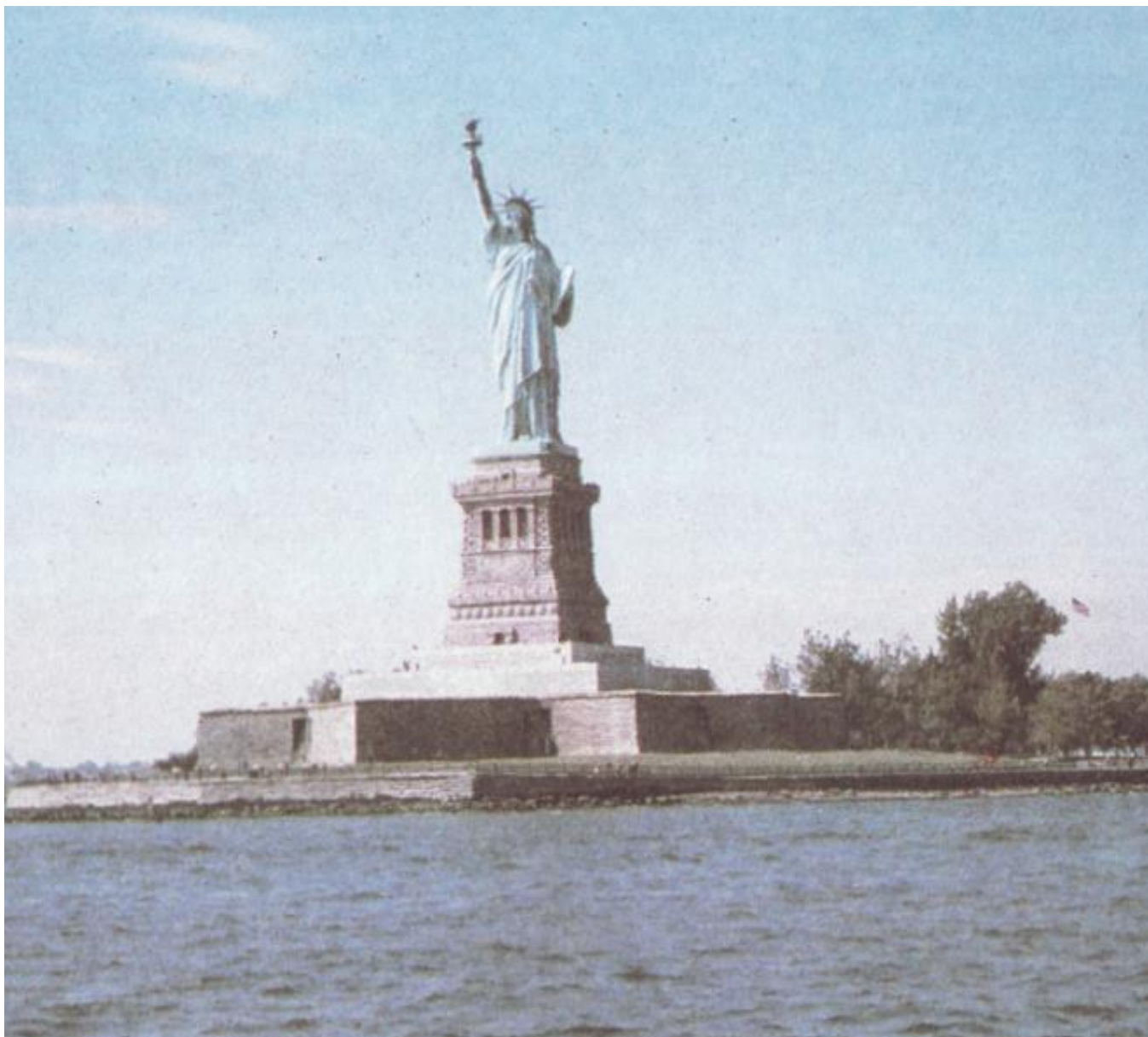
The Statue of Liberty