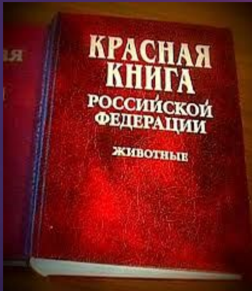
The Red Book

ОБЩЕРОССИЙСКОЕ ОБЩЕСТВЕННОЕ УЧРЕЖДЕНИЕ Общественный институт экологической экспертизы «ЭКОЭК»