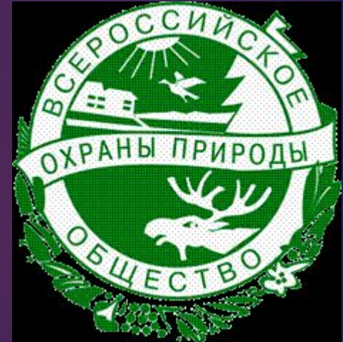
Russian Society for Nature Conservation