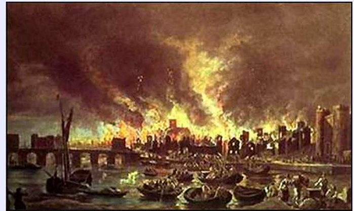
The Great Fire of London, 1666. Lieve Verschuer.

The buildings were also very close together, so the fire spread from one street to another quickly.