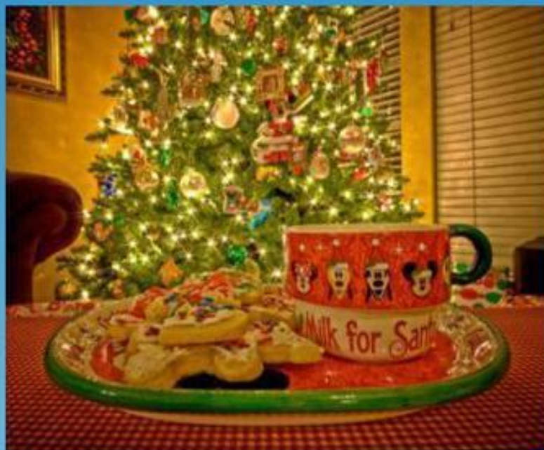
Milk and biscuits