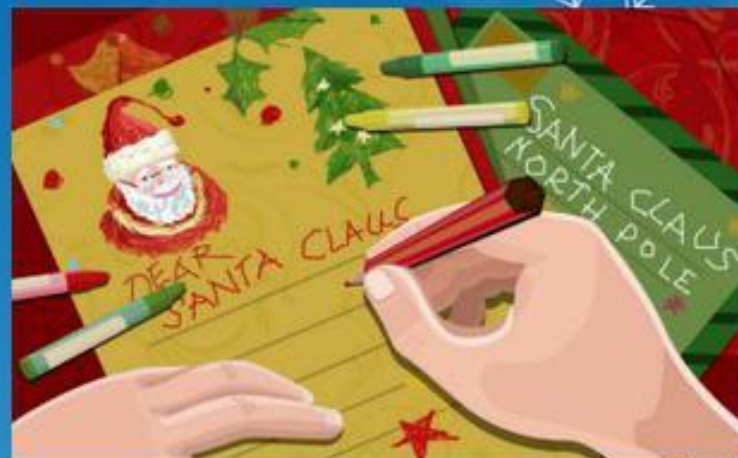
A letter to Santa