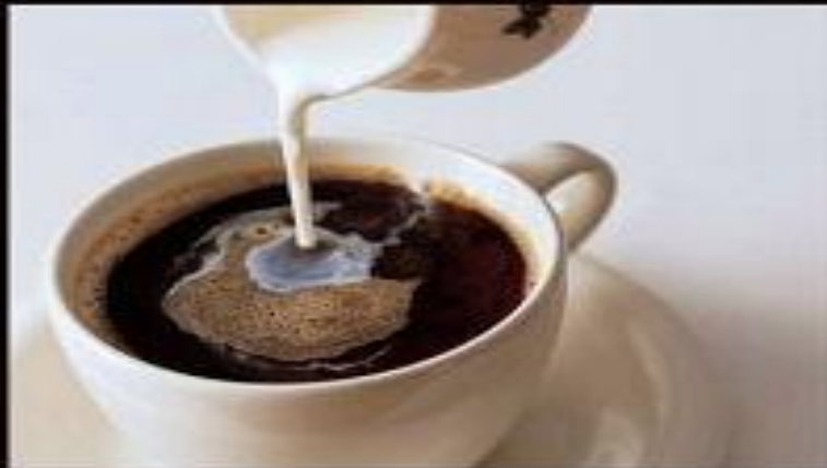
кофе со сливками cream coffee