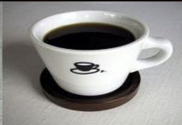
Крепкий кофе strong coffee

сваренный кофе-brewed coffee растворимый кофе-instant coffee