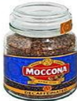
кофе без кофеина decaffeinated разг. unleaded