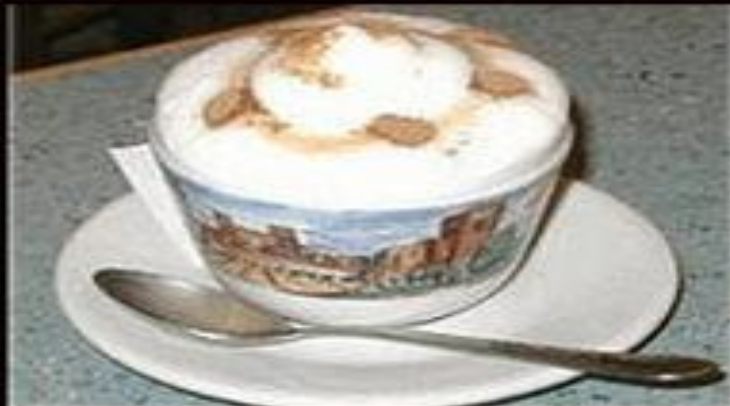
кофе-гляссе iced coffee